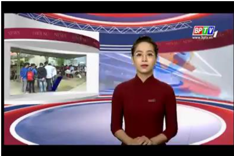
↑クッキングコンテスト