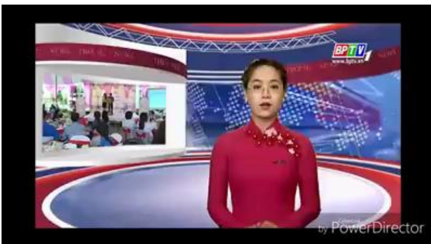
↑ホストファミリー お別れ会