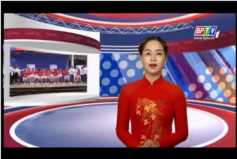
↑ティーチングアクティビティ